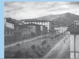
la piazza negli anni '30