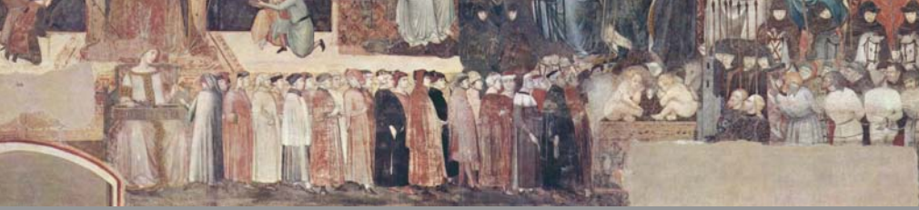
La copertina: Allegoria del Buon Governo (1338-39) Ambrogio Lorenzetti, Palazzo Pubblico di Siena. Particolare del Bene Comune. di fianco: a sinistra la processione dei cittadini che si tengono insieme liberamente legati, a destra i malfattori legati perché privati della loro libertà.

“Ho imparato che il problema degli altri è uguale al mio. Sortirne tutti insieme è politica, sortirne da soli è avarizia.”