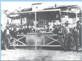
1898, il mercato settimanale