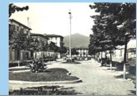
la piazza negli anni '60