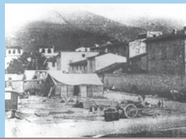
1912, preparativi per la fiera