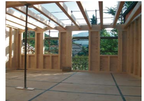
in questa pagina esempi di costruzioni con tipologia X-LAM immagini di cantiere nella fase di assemblaggio dei componenti in legno lamellare

campo del contenimento energetico. Inoltre essendo il legno un materiale più leggero della muratura, indubbi sono i vantaggi rispetto alla normativa antisismica. L'uso del legno nei restauri e soprattutto nelle ristrutturazioni rimane un campo con ottime possibilità di sviluppo.