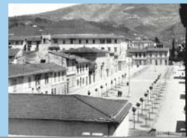
la prima piantumazione