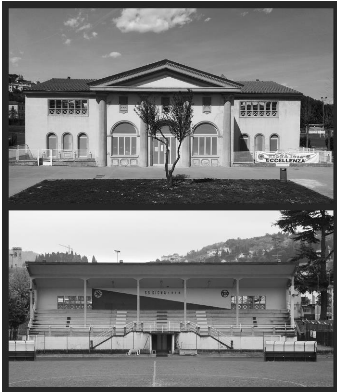
Figura 3. Prospetti della tribuna-palestra

tribuna (e non è stata trovata nessuna pratica amministrativa che riguardi tale intervento). Negli anni '70 e '80 sono stati realizzati diversi interventi sia all'interno del fabbricato che all'esterno. A metà degli anni '90 sono stati realizzati dei lavori finalizzati all'adeguamento alle norme di sicurezza dell'impianto sportivo.